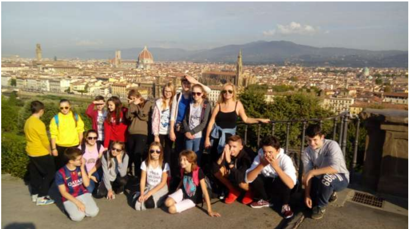
Z placu Michała Anioła podziwialiśmy panoramę Florencji