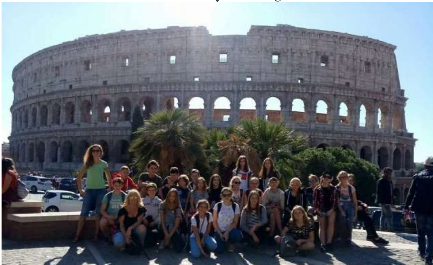
Colosseum w starożytności Amfiteatr Flawiuszów , wzniesiony w latach 70-72 do 80 n.e.